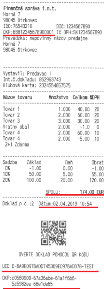
Obrázok č. 1: on-line pokladničný doklad